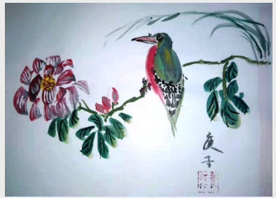
《春晖》 齿轮二工厂 晋开河