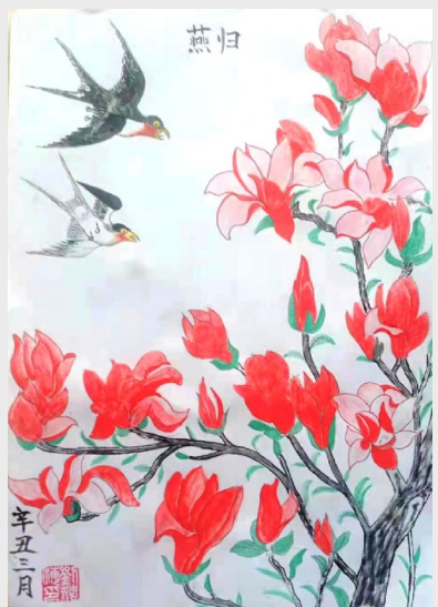
《燕归》 齿轮二工厂 刘荷海