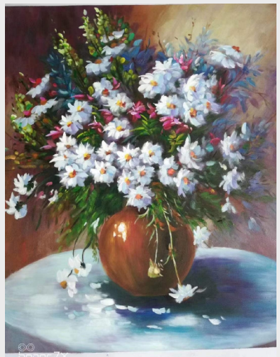
《瓶中花》 齿轮二工厂 李娅娟